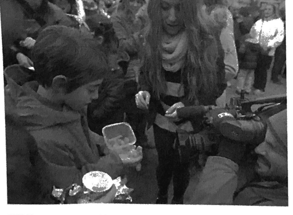
130 Level 2 🗕 Tema 4

Filmando la tradición de las doce uvas, Madrid, España